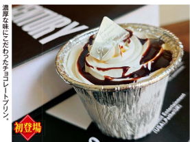
「福岡/Anthology」 チョコレートクリームプリン(1個).....(税込)500円