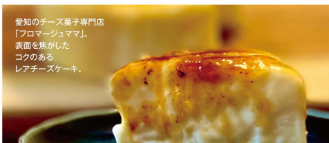
愛知のチーズ菓子専門店 「プロマージュマ」 表面を焦がした ココのある レアチーズケーキ。