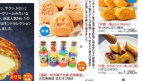
「福岡/和洋菓子本舗 恋寿華堂」 恋恋寿華堂 恋もすび焼き (8個入).....(税込)540円 ③幸せの紅色金平糖ミニオパール (40g).....(税込)1,188円