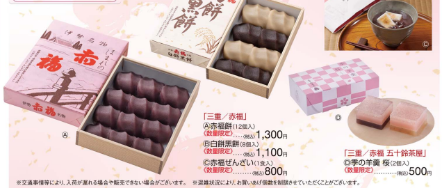
「三重/赤福」 ①赤福餅(2個入) (数量限定).....(税込)1,300円 ②白餅餅(8個入) (数量限定).....(税込)1,100円 ③赤福ぜんざい(1食入) (数量限定).....(税込)800円

※交通事情等により、入荷が遅れる場合や販売できない場合がございます。 ※選定状況により、お買い得価格を設定させていただく場合がございます。