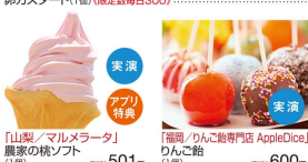
「山梨/マルメレータ」 農家の梅ソフト (1個).....(税込)501円