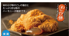
「香川/松風庵かねすえ」 特製名菓わらび餅(1個).....(税込)1,300円