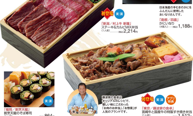
「新潟/村上牛 新耀」 ステーキ&カルビMIX弁当 (1人前).....(税込)2,214円