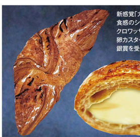
「大阪/カリカリクワッパン専門店 CARI DE CRO(カリクロ)」 卵カスター(1個)(限定数毎日300).....(税込)350円