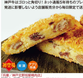
「兵庫/神戸北野屋焼肉店」 神戸ビーフプレミアムコロッケ(1個)(限定数毎日600).....(税込)378円