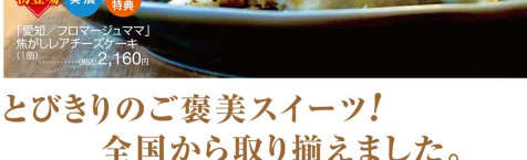
「厚知/プロマージュマ」 焦がしレアチーズケーキ (1個).....(税込)2,160円