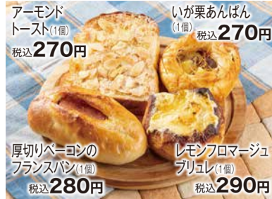
アーモンドトースト(1個) 税込 270円 いが栗あんぱん(1個) 税込 270円 厚切りベーコンのフランスパン(1個) 税込 280円 レモンフロマージュブリョレ(1個) 税込 290円