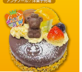
ハロウィンショコラ(1個) 税込 1,836円 ケービスクローネ/洋菓子売場