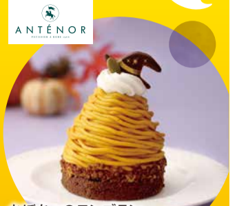
かぼちゃのモンブラン(1個) 税込 734円 アンテノール/洋菓子売場