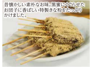
昔懐かしい素朴なお味。黒蜜にくぐらせたお団子に香ばしい特製きな粉をたっぷりかけました。 京 嵐山団子 4連(20本) 税込 794円