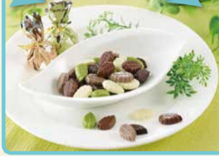
リーフメモリー(250g入) 税込 950円 ココアミルク(250g入) 税込 950円 クラッシュアーモンド(22個入) 税込 950円 アソート(300g入り) 税込 1,170円