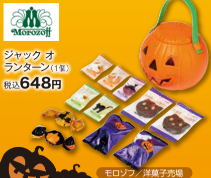
ジャック オランタン(1個) 税込 648円 Morozoff/洋菓子売場