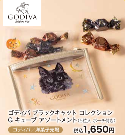
ゴディバ ブラックキャット コレクション G キューブ アソートメント(5粒入 ボーチ付き) 税込 1,650円 ゴディバ/洋菓子売場