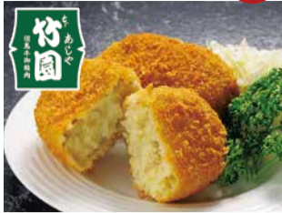
竹園特製コロッケ (1個) 税込 162円